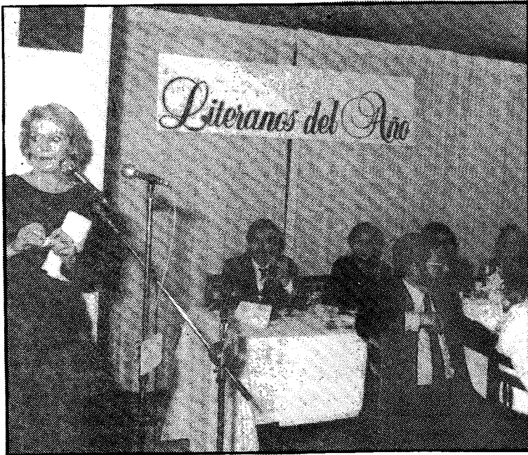
Las ediciones de otros años de los "Personajes Litera" han estado muy animadas

Será a partir de esta nominación cuando comenzarán las votaciones, que podrán realizarse a través de los espacios insertados